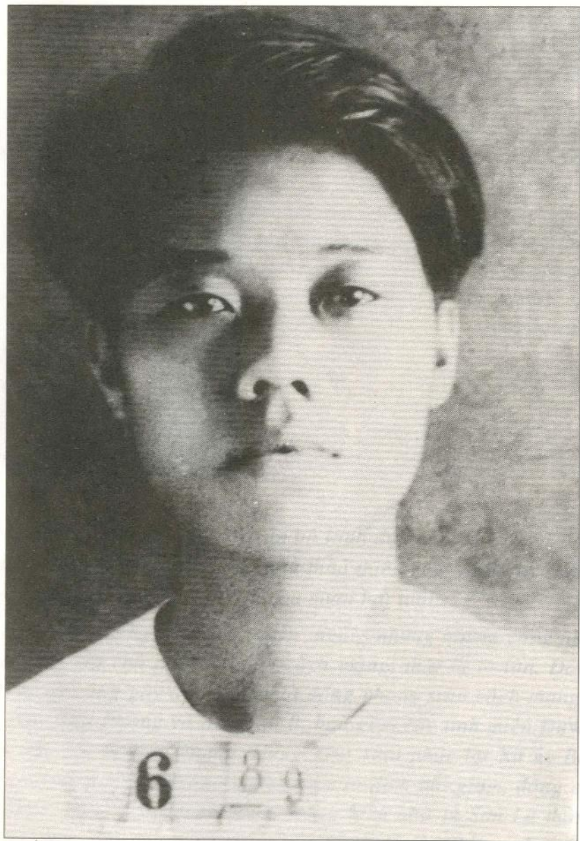
Đồng chí TÔ HIỆU lúc 18 tuổi bị địch bắt đày đi Côn Đảo năm 1930